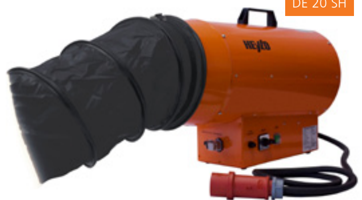
DE 20 SH