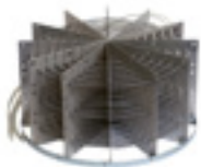
Spezial-Heizeinsatz aus hochlegiertem Stahl