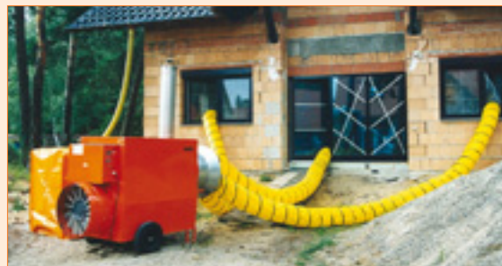
Beheizung in der Bauphase