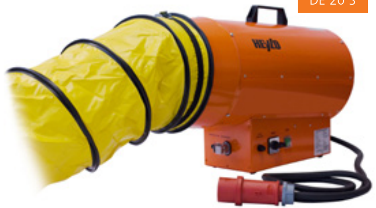
DE 20 S